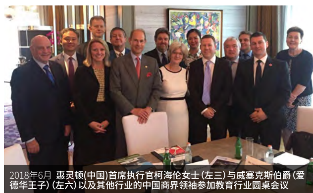
2018年6月 惠灵顿(中国)首席执行官柯海伦女士(左三)与威塞克斯伯爵(爱德华王子)(左六)以及其他行业的中国商界领袖参加教育行业圆桌会议