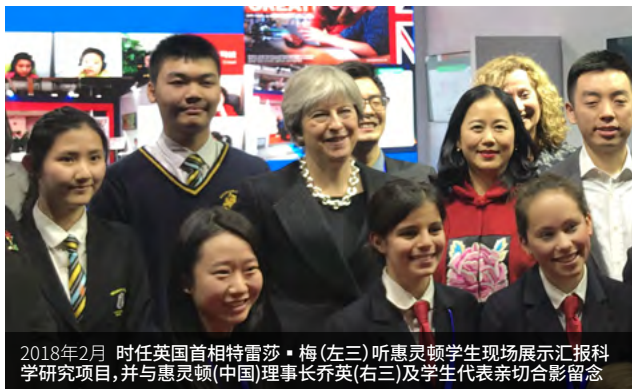
2018年2月 时任英国首相特雷莎·梅(左三)听惠灵顿学生现场展示汇报科学研究项目,并与惠灵顿(中国)理事长乔英(右三)及学生代表亲切合影留念