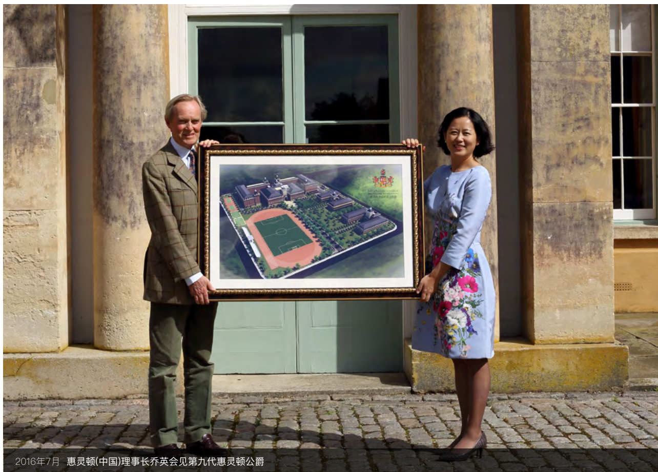
2016年7月 惠灵顿(中国)理事长乔英会见第九代惠灵顿公爵