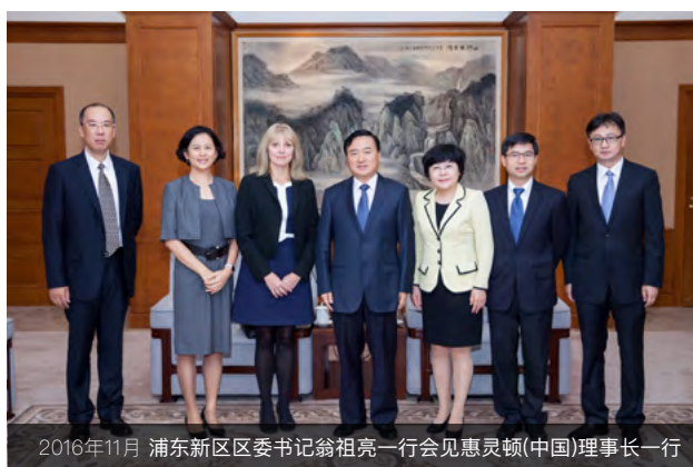
2016年11月 浦东新区区委书记翁祖亮一行会见惠灵顿(中国)理事长一行