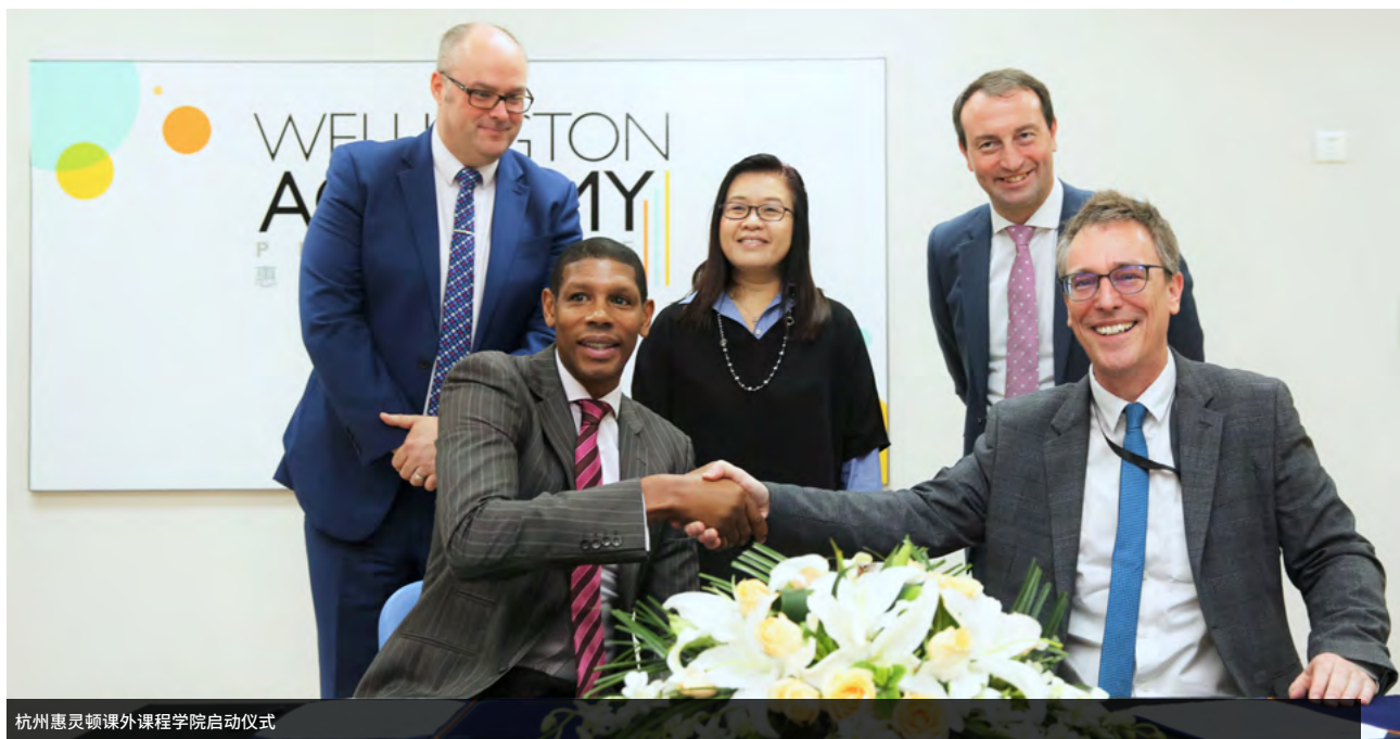
杭州惠灵顿课外课程学院启动仪式

惠灵顿课外课程学院发展迅速,由原来的两个校区扩展成四个校区。我们有着一支非常杰出的教师团队和外部合作伙伴,我们一起努力为学生提供高质量的课程服务。我们的教学团队热衷于并且致力于为学生提供新的学习经历和高质量的课程内容。请快加入我们的教学计划活动吧,来体验一下我们的优质教学服务。