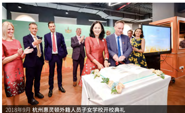
2018年9月 杭州惠灵顿外籍人员子女学校开校典礼