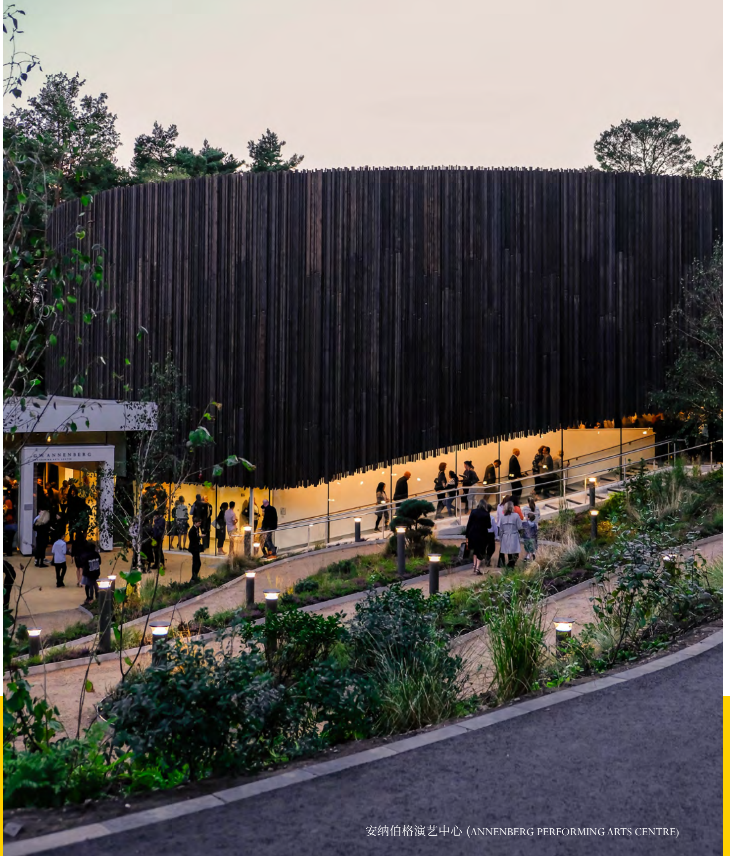
安纳伯格演艺中心 (ANNENBERG PERFORMING ARTS CENTRE)