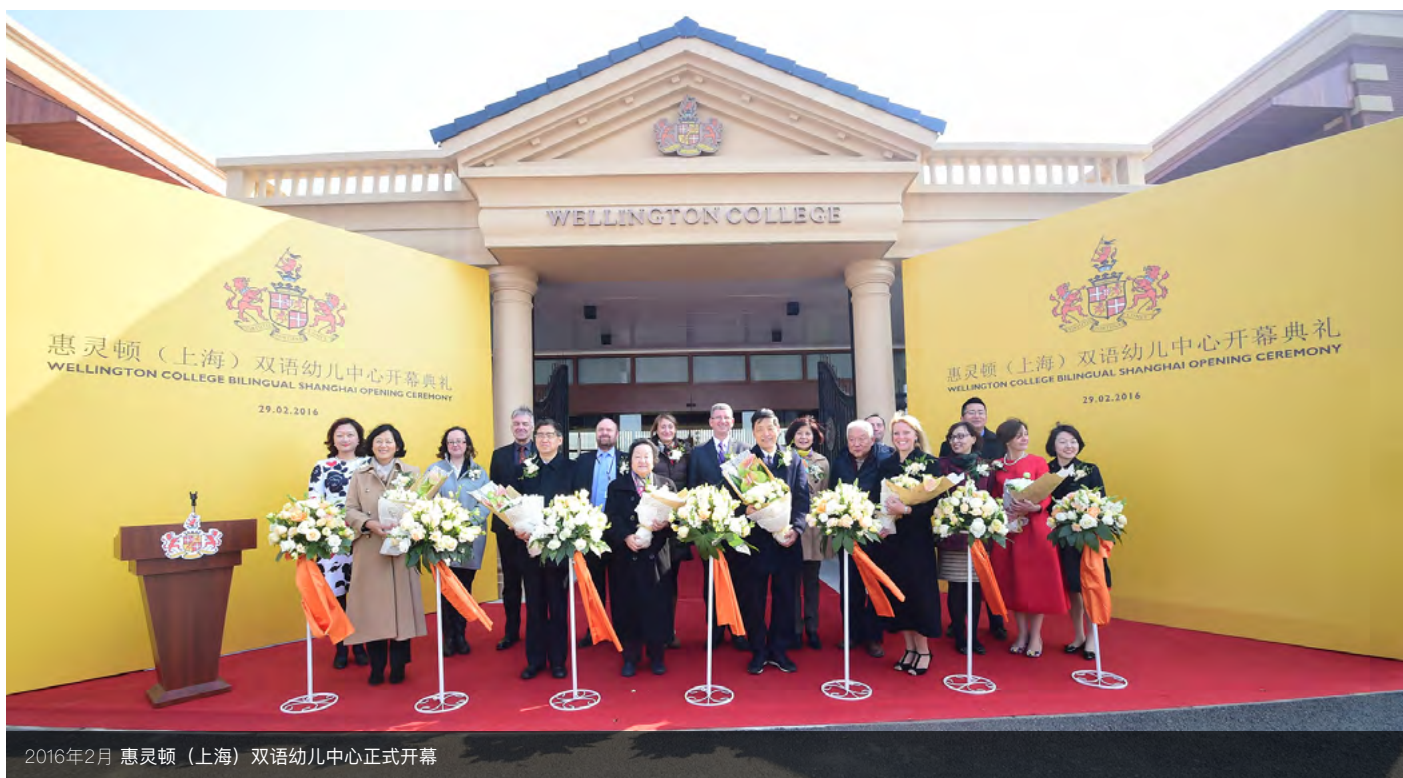
2016年2月 惠灵顿（上海）双语幼儿中心正式开幕