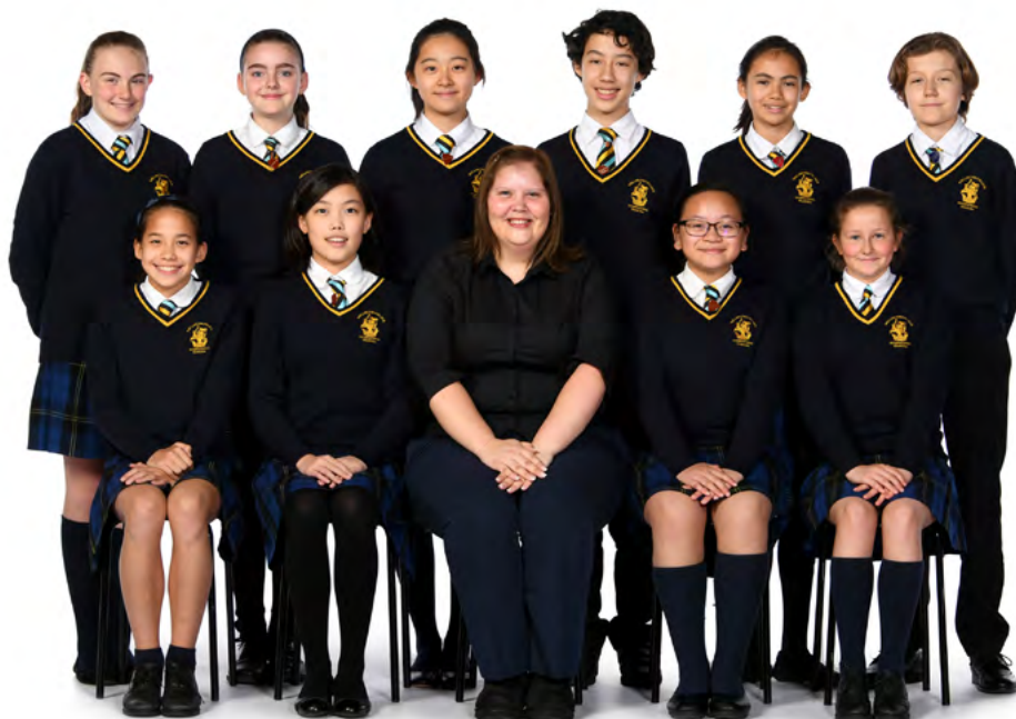
上海惠灵顿外籍人员子女学校 2017-2018届 生活委员