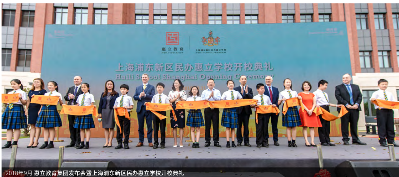
2018年9月 惠立教育集团发布会暨上海浦东新区民办惠立学校开校典礼