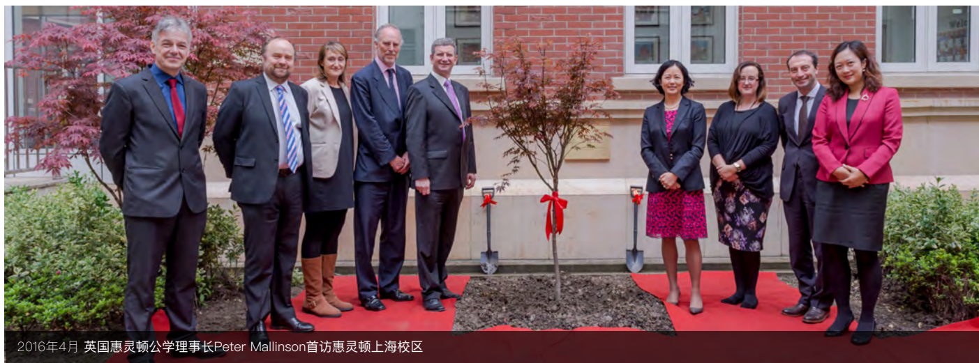
2016年4月 英国惠灵顿公学理事长Peter Mallinson首访惠灵顿上海校区