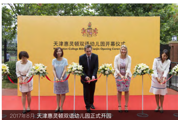
2017年8月 天津惠灵顿双语幼儿园正式开园