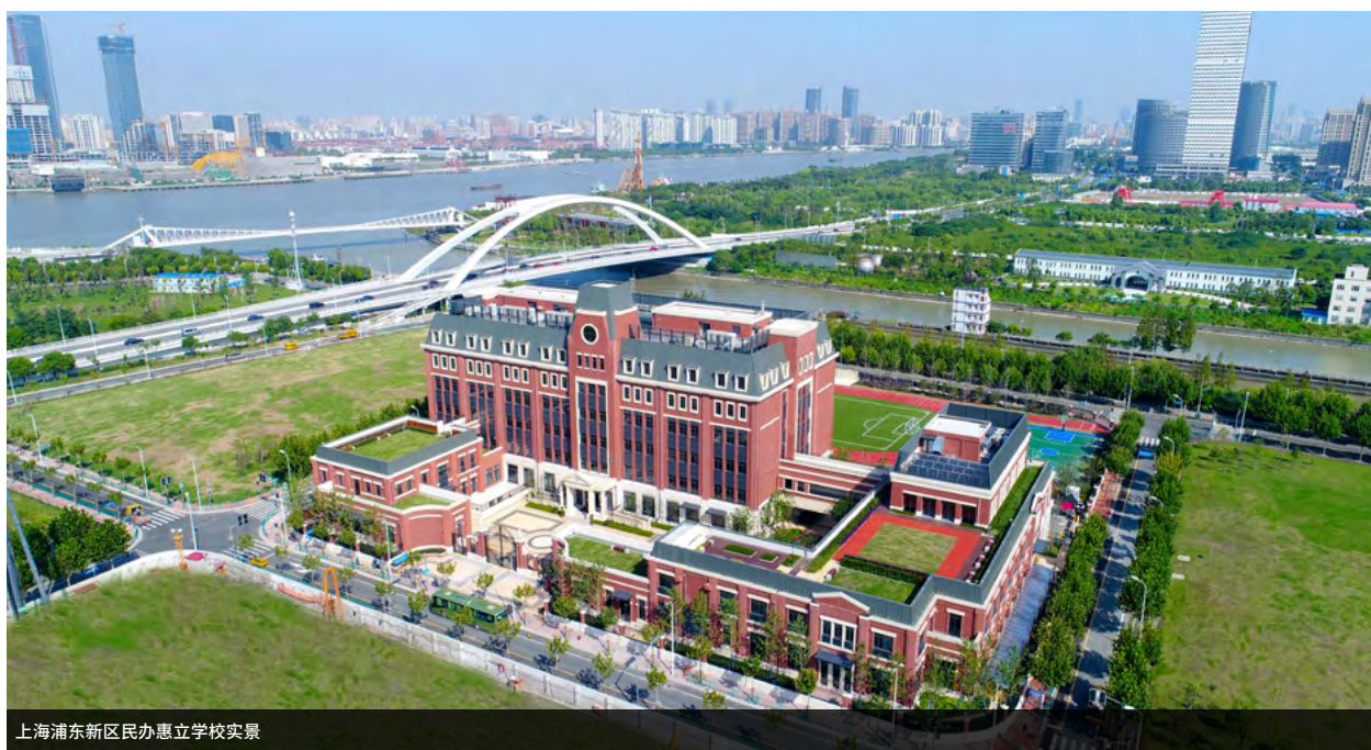
上海浦东新区民办惠立学校实景

惠立教育研究院的正式成立和上海浦东新区民办惠立学校的开校，标志着惠立教育集团在中国发展的起点。除惠立教育研究院和上海惠立学校外，惠立集团旗下成员还包括：上海浦东新区民办惠立幼儿园、杭州市萧山区惠立学校以及杭州市萧山区惠立幼儿园。