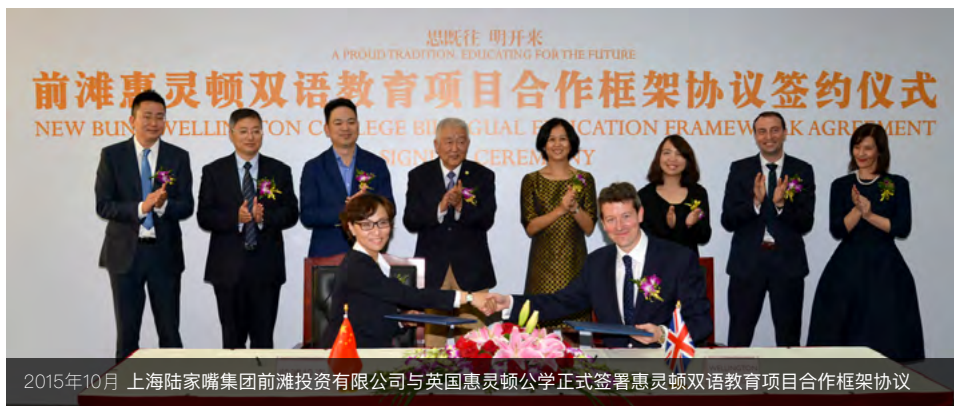
2015年10月 上海陆家嘴集团前滩投资有限公司与英国惠灵顿公学正式签署惠灵顿双语教育项目合作框架协议