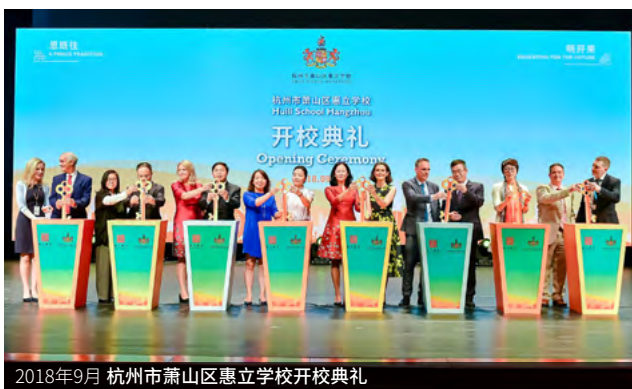
2018年9月 杭州市萧山区惠立学校开校典礼