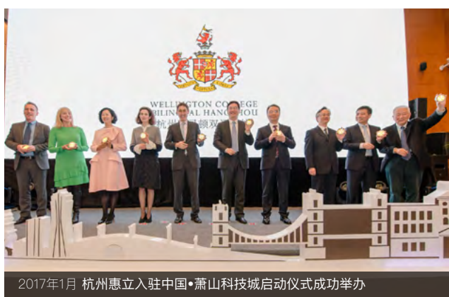
2017年1月 杭州惠灵入驻中国·萧山科技城启动仪式成功举办