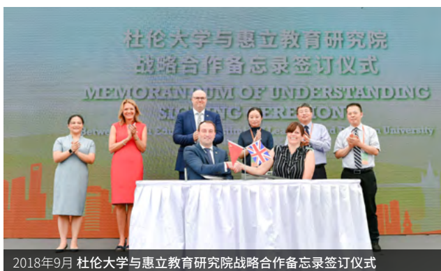
2018年9月 杜伦大学与惠立教育研究院战略合作备忘录签订仪式