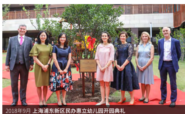
2018年9月 上海浦东新区民办惠立幼儿园开园典礼